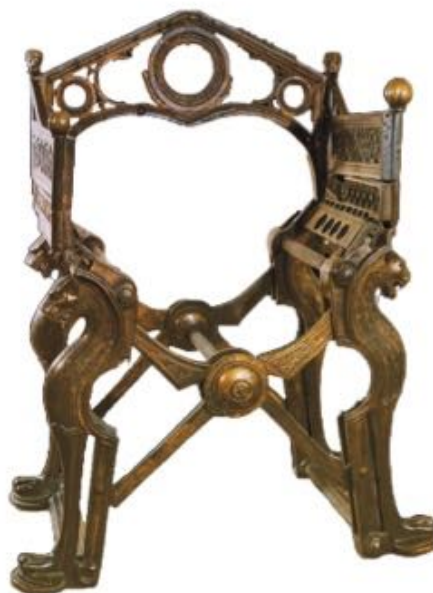
Le trône dit « de Dagobert » Époque mérovingienne et carolingienne - Cabinet des médailles de la BNF - Paris - n° Inv : 55-651